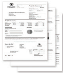
Rechnungen und Auszüge