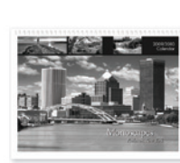
Stanzung über Formeinsatz