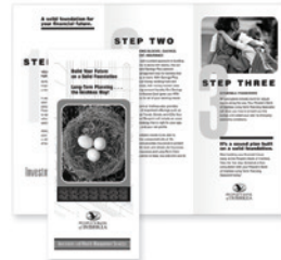
Einbruch-, Wickel- und Leporellofalz