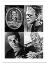
SquareFold Trimmermodul für Broschüren