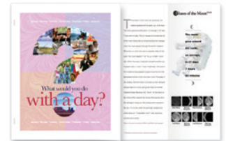
Farbige Trennblätter, Stapel und Architektenfalz