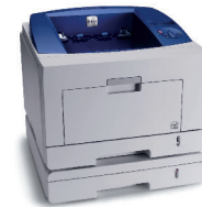
Phaser 3435 abgebildet mit optionalem Papierfach 2