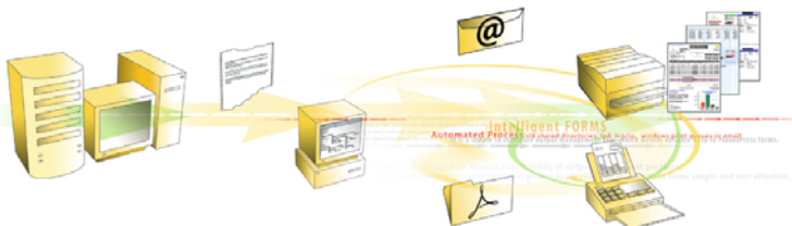
Workflow und automatische Dokumentenverteilung: Drucken, E-Mail, Archiv, Fax