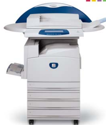
WorkCentre Pro C2636