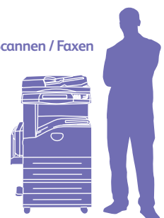
WorkCentre 5230 mit Zweibehälter-Modul