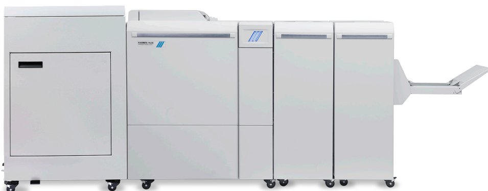
Plockmatic Pro50/35 Booklet Maker, hergestellt von der Plockmatic International AB

Schnelles Erstellen von Broschüren in Profi-Qualität mit einer kompakten, preisgünstigen Inline-Lösung.