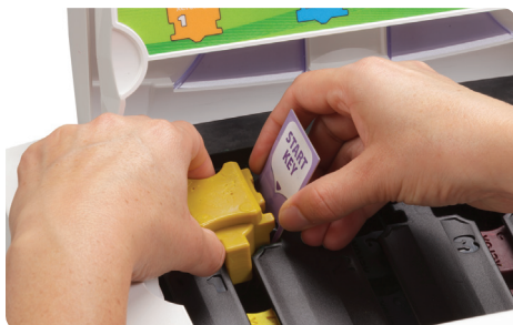
Schwieriges und umständliches Auffüllen von Tinte bei Billigmarkentinte – erfordert einen Schlüssel zum Austricksen des Sensors.

Beachten Sie die weißen Punkte, die beim Drucken mit Festtinte von anderen Herstellern entstehen.