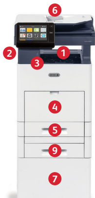
Xerox® VersaLink® B605 Multifunktionsdrucker Drucken. Kopieren. Scannen. Faxen. E-Mail.