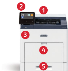
Xerox® VersaLink® B600 Drucker Drucken.