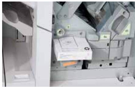
Einfach einzulegende Klebebandkassetten

Die Bedienung des Xerox® Tape Binders ist einfach. Die Wahl der Auftragseinstellungen, Statusprüfung und Bedienung erfolgt direkt am Bedienfeld des Tape Binders. Das Auswechseln des Klebebands ist mit den praktischen Kassetten so einfach wie noch nie.